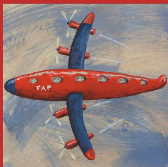
Sem título, acrílico s/papel, 2010, 28x28 cm