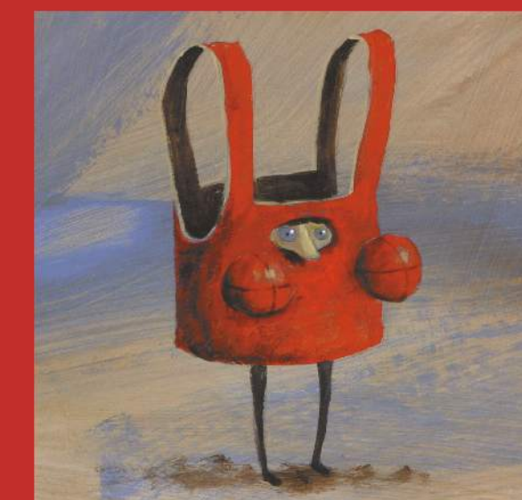
Sem título, acrílico s/papel, 2010, 18,5x20 cm