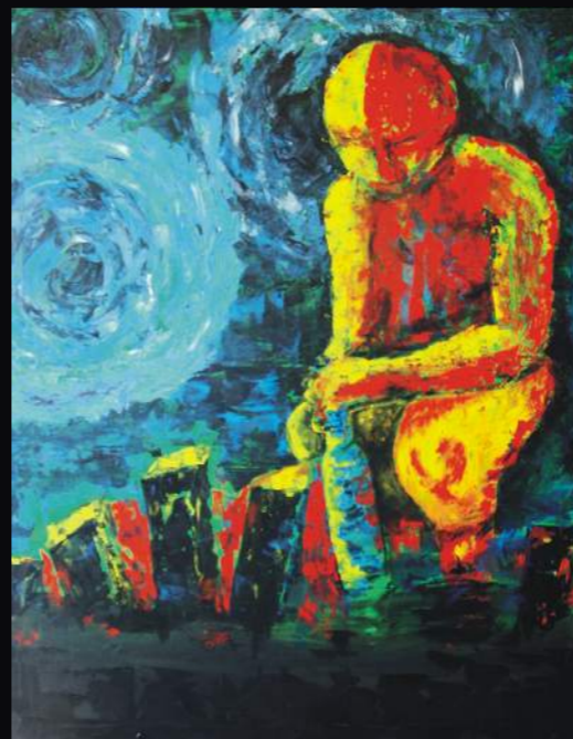
NUNES DA ROCHA Bebedor nocturno II