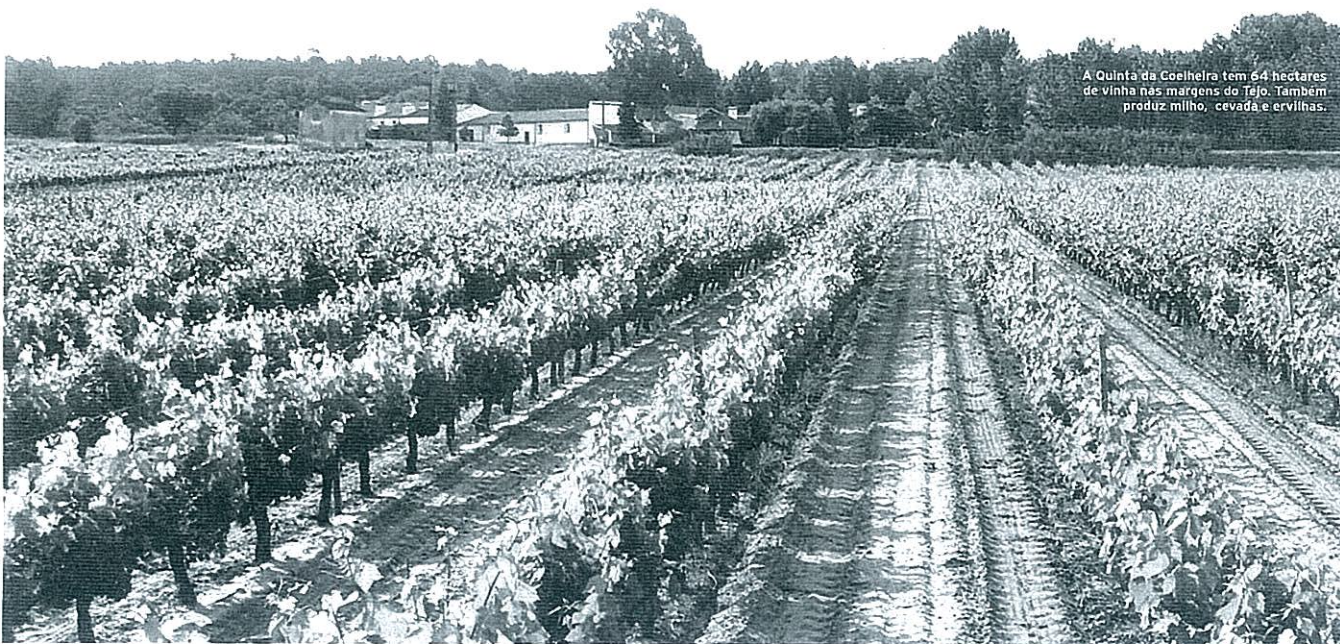
A Quinta da Coelheira tem 64 hectares de vinha nas margens do Tejo. Também produz milho, cevada e ervilhas.